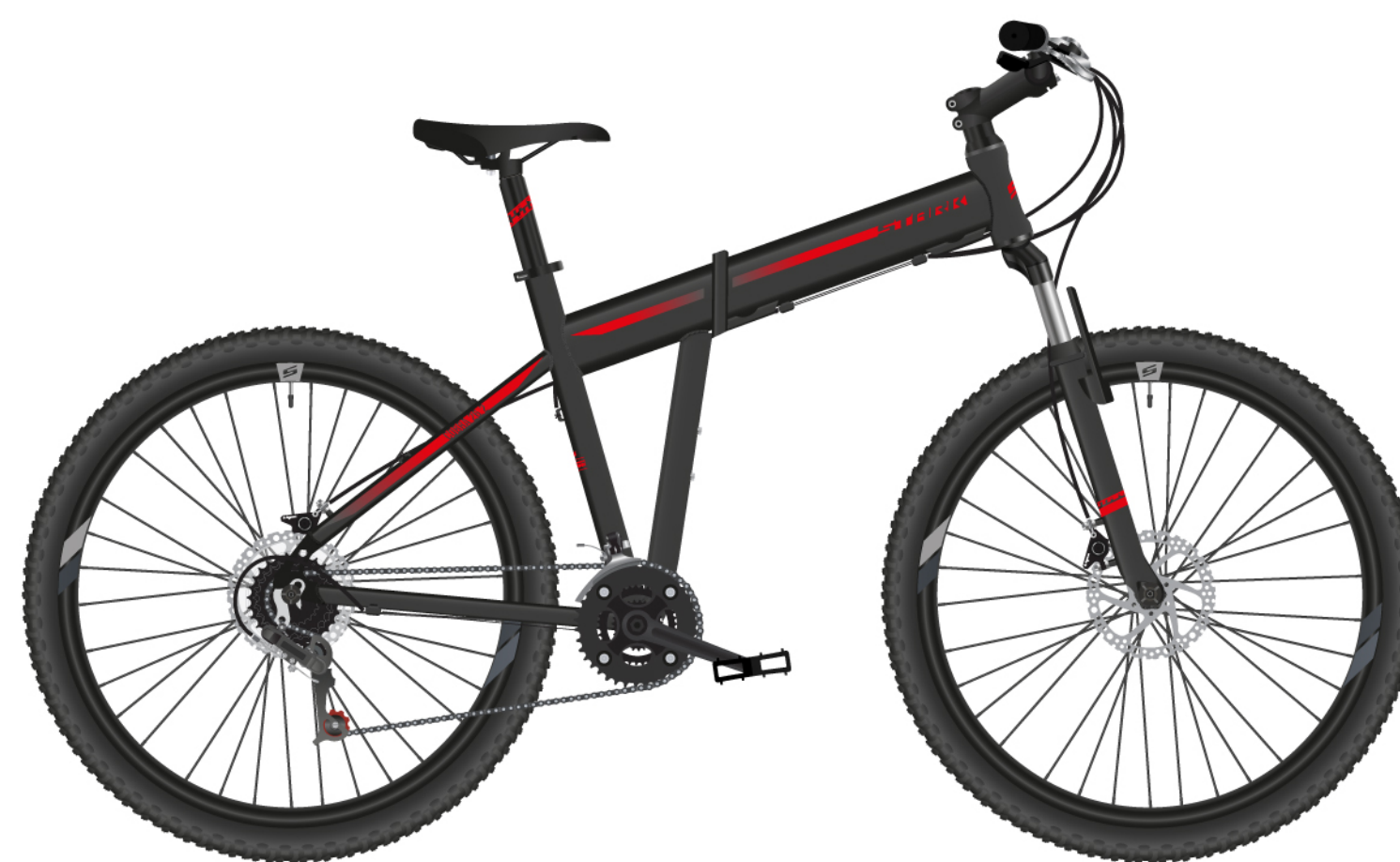
COBRA 27.2 D. BLACK/GRAY